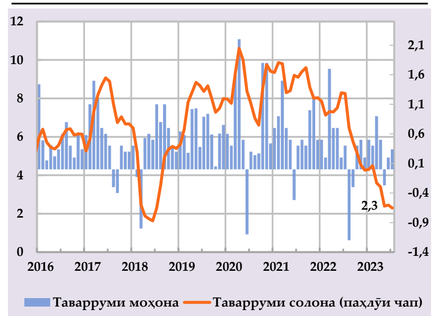
Increase of prices for consumer goods and its share in the annual inflation, in %