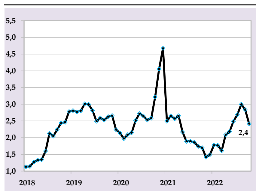
Таварруми аслии солона, бо %