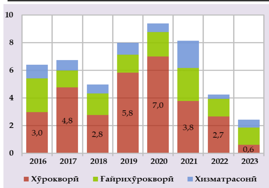
Сатҳи таваррум дар кишварҳои шарикони савдо ва минтақа (бо фоиз) (манбаъ: Мақомоти омили давлатҳо)