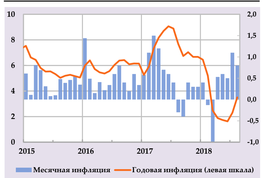
Рост группы потребительских цен и их структурный вклад, в % годовых