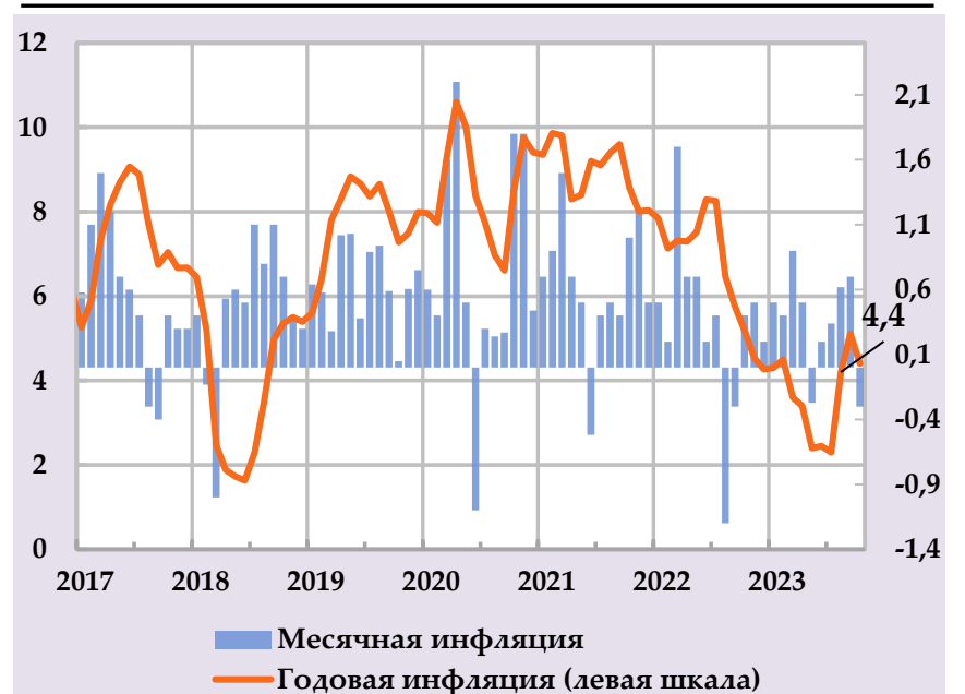
Рост группы потребительских цен и их вклад в структуру годовой инфляции, в %