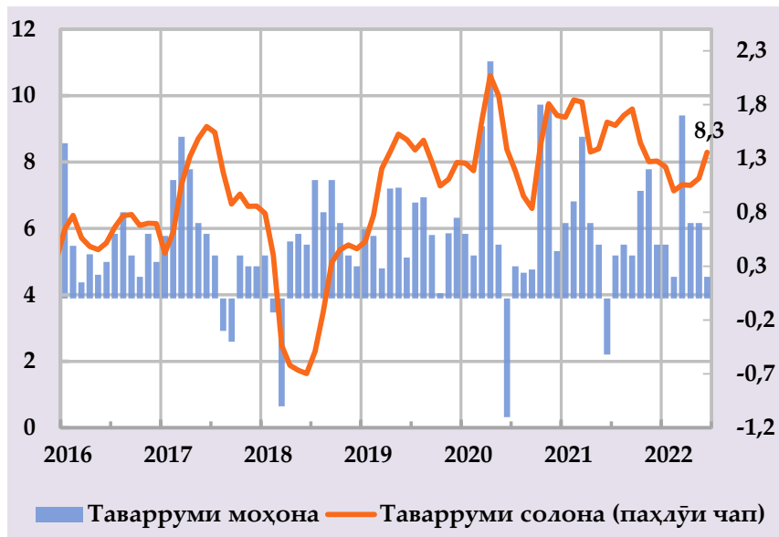
Афзоиши гурӯҳи нархҳои истеъмоли ва саҳми сохтори онҳо дар таварруми солона, бо %