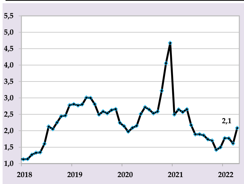
Таварруми аслии солона, бо %, (манбаъ: Агентии омор, ҳисобҳои БМТ)