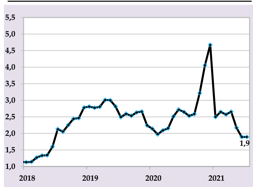
Базовая инфляция, в % годовых

В целях предотвращения дополнительных инфляционных давлений Национальный банк Таджикистана в рамках своих полномочий продолжит реализацию сбалансированной денежно-кредитной политики посредством использования монетарных инструментов.