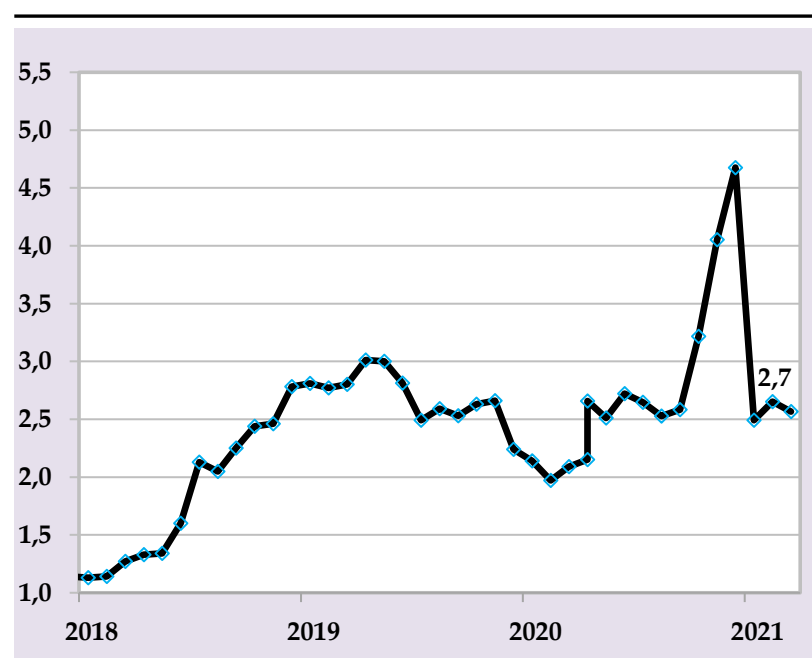
Базовая инфляция, в % годовых

В целях предотвращения дополнительных инфляционных давлений Национальный банк Таджикистана продолжит реализацию сбалансированной денежно-кредитной политики посредством эффективного использования монетарных инструментов.