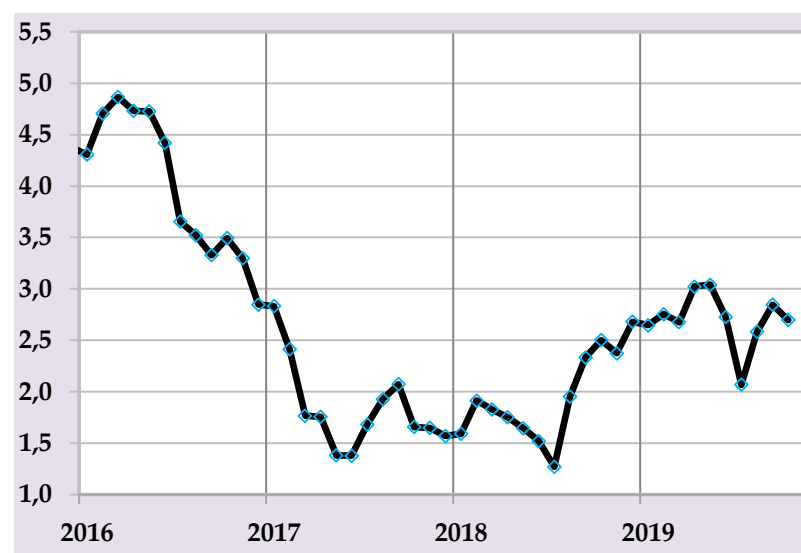
Базовая инфляция, в % годовых

В целях предотвращения дополнительных давлений на уровень инфляции и достижения до конца года предусмотренного целевого показателя, Национальный банк Таджикистана продолжит реализацию сбалансированной и эффективной денежно-кредитной политики.