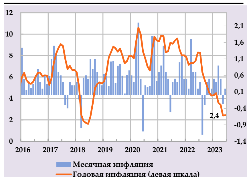
Рост группы потребительских цен и их вклад в структуру годовой инфляции, в %