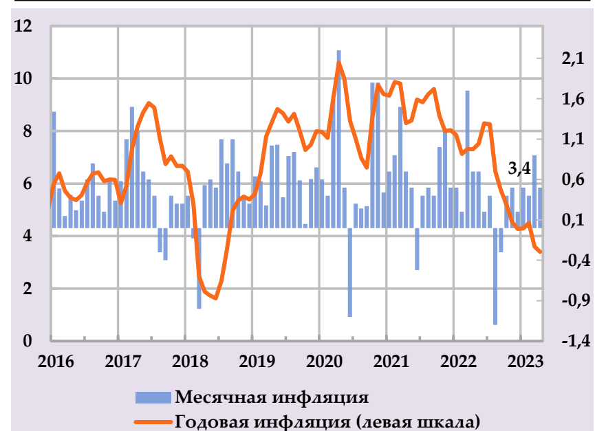
Рост группы потребительских цен и их вклад в структуру годовой инфляции, в %