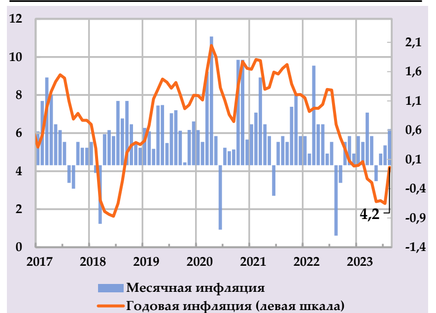
Рост группы потребительских цен и их вклад в структуру годовой инфляции, в %