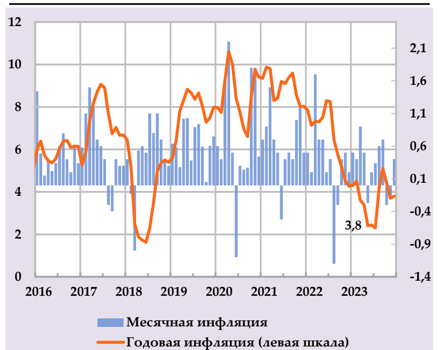
Рост группы потребительских цен и их вклад в структуру годовой инфляции, в %