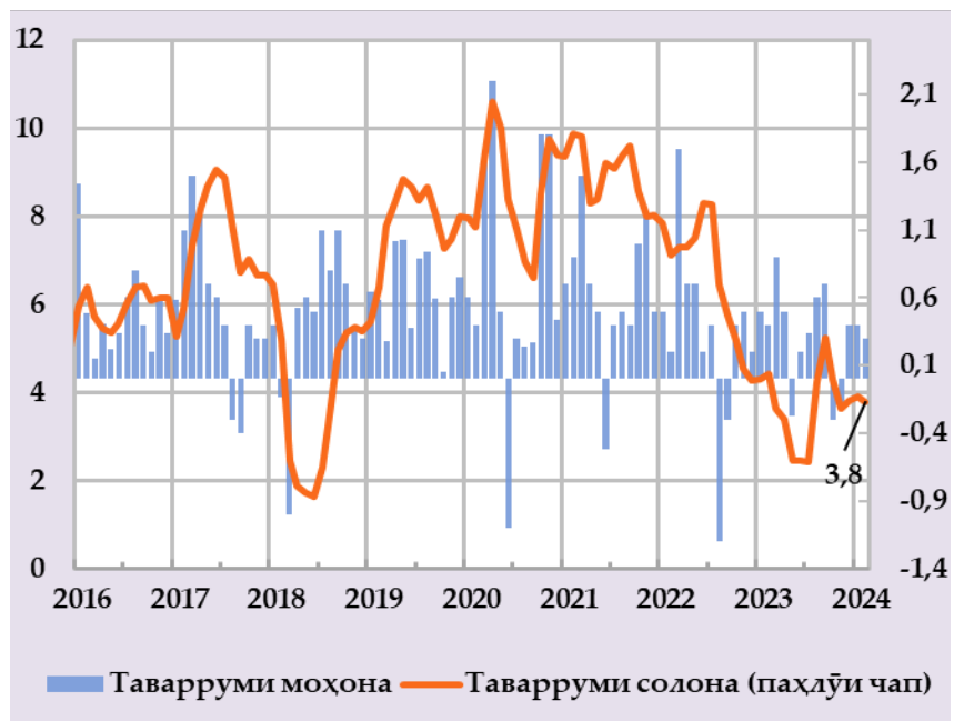
Афзоиши гурӯҳи нархҳои истеъмолий ва саҳми сохтори онҳо дар таварруми солона (бо фоиз) (манбаъ: Агентии омор, ҳисобҳои БМТ)