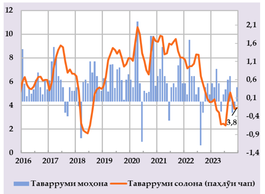
Афзоиши гурӯҳи нархҳои истеъмолӣ ва сатҳи сохтори онҳо дар таварруми солона (бо фоиз) (манбаъ: Агентии омор, ҳисобҳои БМТ)