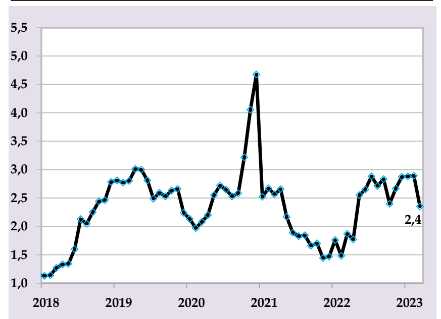
Annual core inflation, in %, (Source: Agency of Statistics, accounts of NBT)

The National Bank of Tajikistan will continue to implement the monetary policy in order to reduce the impact of monetary factors on the inflation rate for achieving the projected target indicator using monetary levers.