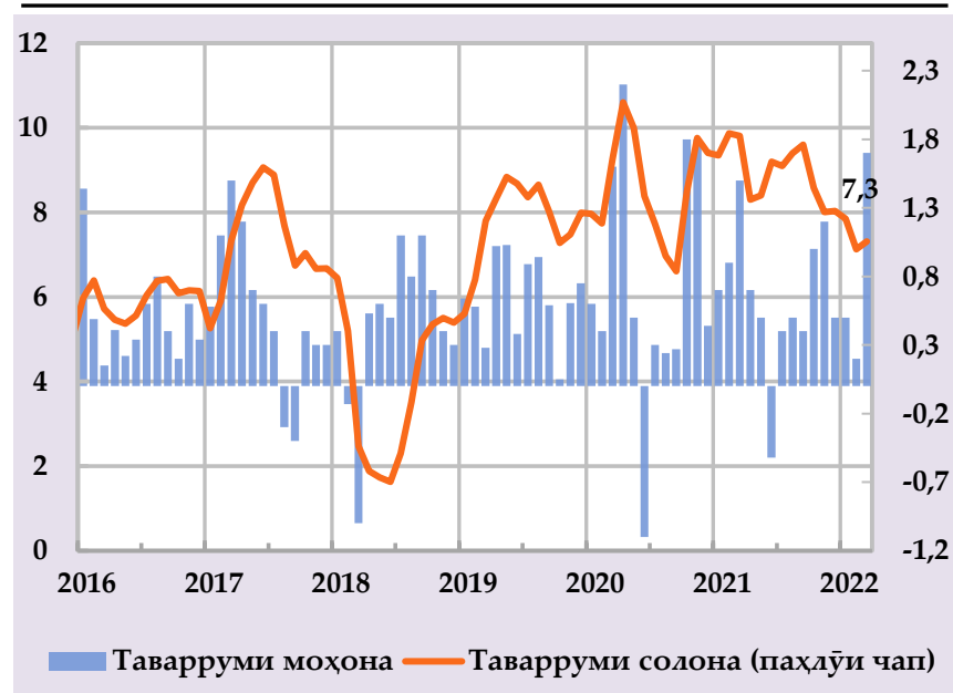
Афзоиши гурӯҳи нархҳои истеъмоли ва саҳми сохтори онҳо дар таварруми солона, бо % (манбаъ: Агентии омор, ҳисобҳои БМТ)