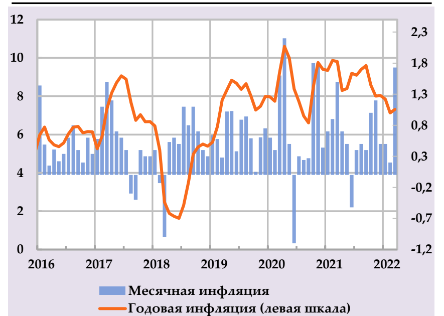
Рост группы потребительских цен и их вклад в структуру годовой инфляции, в %