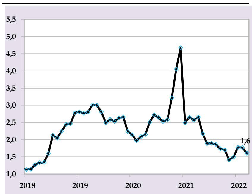
Базовая инфляция, в % годовых

Национальный банк Таджикистана продолжит реализацию денежно-кредитной политики по снижению влияния монетарных факторов на инфляцию с использованием монетарных инструментов для достижения целевого показателя.