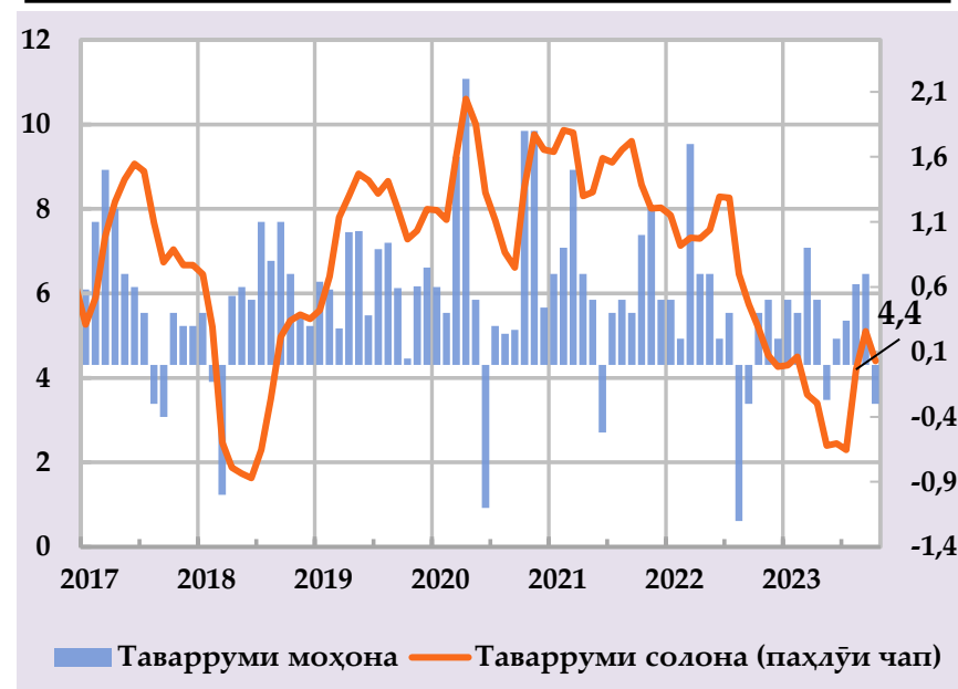
Афзоиши гурӯҳи нархҳои истеъмолӣ ва саҳми сохтори онҳо дар таварруми солона (бо фоиз)